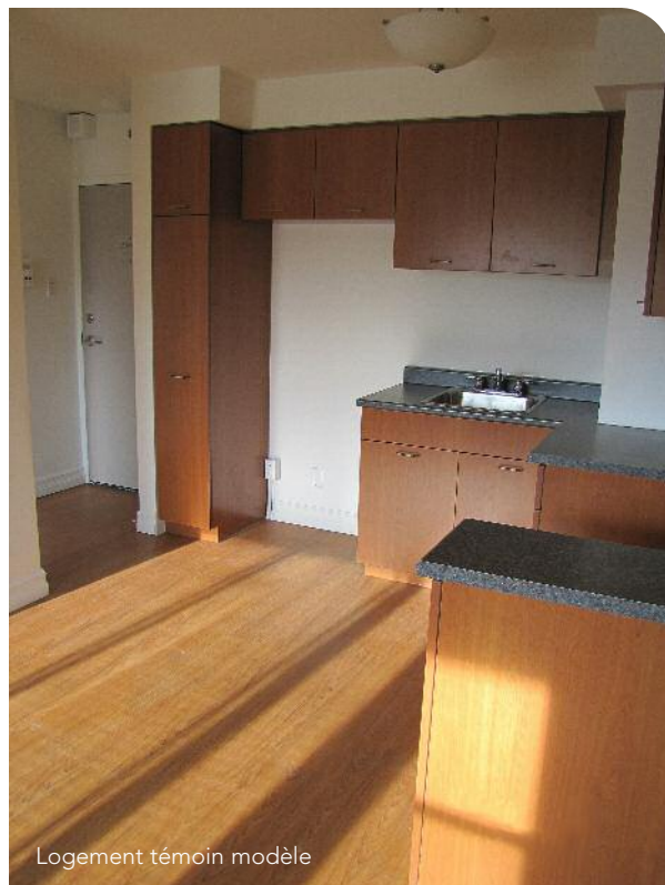
Logement témoin modèle