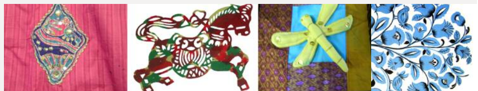
Images provenant de rencontres culturelles avec la classe de francisation.