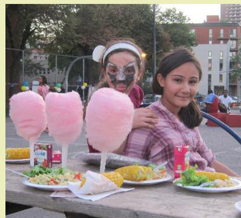
19h52, quelques instants avant la fin du ramadan...